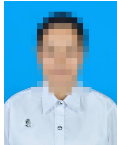
นิสิตหญิง