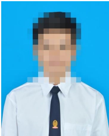
นิสิตชาย